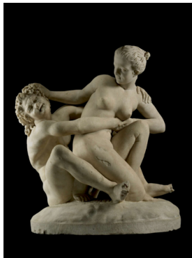
Ill. 2. Nymphe tentant d'échapper à un satyre, Romain, IIe siècle ap. J.-C. d'après un original grec du IIe siècle av. J.-C., marbre, H. : 75 cm. British Museum, Londres, no. inv. 1805,0703.2.