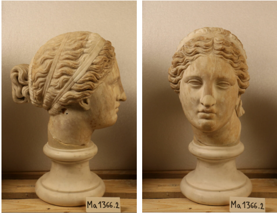
Ill. 7. Tête d'Aphrodite de Cnide, Romain, IIème siècle ap. J.-C., marbre, H. : 32,5 cm. Musée du Louvre, Paris, no. inv. N 813.