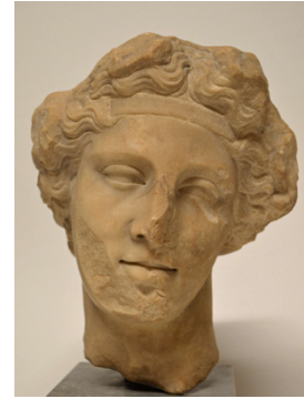
Ill. 4. Tête de ménade, Romain, 80-120 ap. J.-C., marbre, H : 21,50 cm. British Museum, Londres, no. inv. 1861,1127.125.