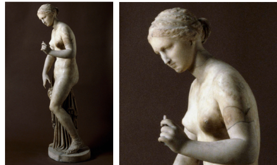
Ill. 6. Statue de Venus, Romain, Ier-IIe siècle ap. J.-C., marbre, H. : 106 cm. British Museum, Londres, no. inv. 1805,0703.16.