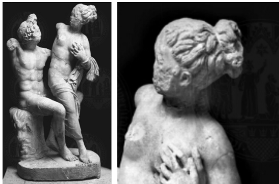
Ill. 3. Nymphe tentant d'échapper à un satyre, Romain, IIe siècle ap. J.-C. d'après un original grec du IIe siècle av. J.-C., marbre, H. : 112 cm. Museo Nazionale Romano, Rome, no. inv. 80005.