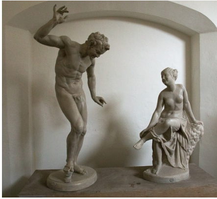
Ill. 1. L'invitation à la danse , Romain, Ier-IIe ap. J.-C. d'après un original grec du IIème siècle av. J.-C., marbre. Université de Rome, La Sapienza, no. inv. 60.1206.