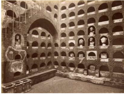
Ill. 5. Columbarium de la Vigna Codini, Rome, construit entre l'époque augustéenne et l'époque tibérienne (premier quart du Ier siècle ap. J.-C.).