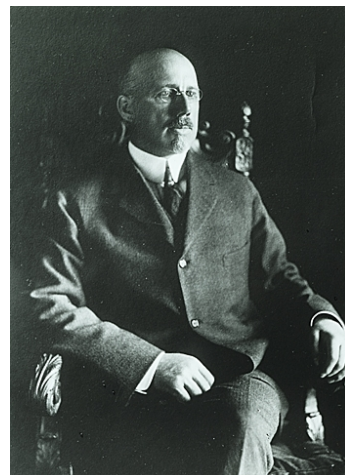
Ill. 11. George Gough Booth, vers 1910-1920.