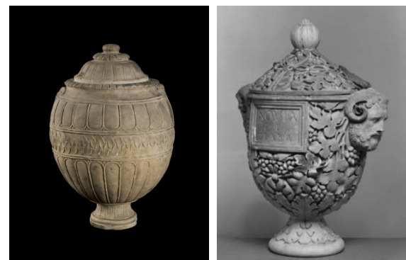
Ill. 3. Urne à couvercle, Romain, I er siècle ap. J.-C., marbre, H. : 55 cm. Paris, musée du Louvre, inv. no. Ma 5217.