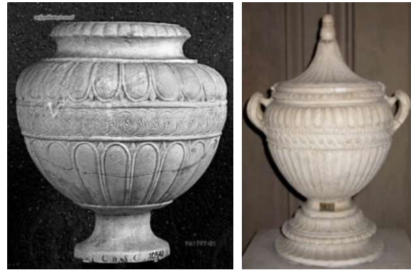
Ill. 1. Urne cinéraire, marbre, I er siècle av. J.-C., H. : 42 cm., Musée grégorien profane, Vatican, no. inv. 10548.Ill.