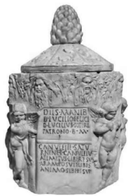
Ill. 6. Urne cinéraire octogonale, marbre, Ier siècle av. J.-C., découvert sur la Via Appia, Rome.