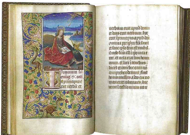
Livre d'heures par le Maître des prélats bourguignons, France, Dijon, 1475-1485, détail