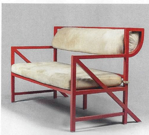
Anna-Lülja Praun, banquette d'une suite de quatre, 1984, laque rouge, laiton nickelé, daim, 90 x 140 x 75 cm (©HERVÉ LEWANDOWSKI, COURTESY GALERIE HP LE STUDIO, PARIS).

« ANNA LÜLJA PRAUN », galerie HP Le Studio, 1, rue Allent, 75007 Paris, 01 40 20 00 56, du 14 mai au 25 juin.