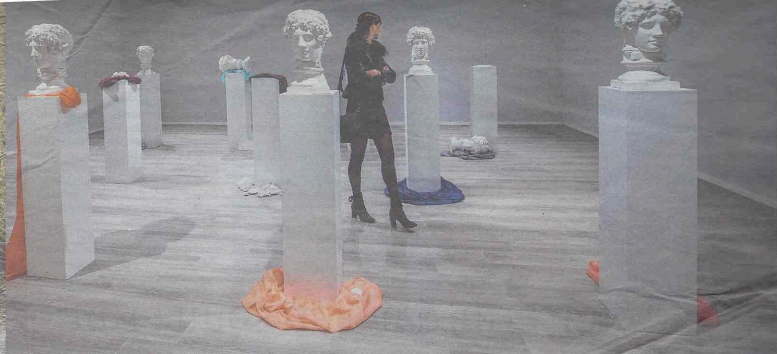
Van linksboven met de klok mee: 'Snow Forest' van Farhad Moshiri, de installatie 'Casa di Lucrezio' van Giulio Paolini, het in marmer gekapte hoofd van Serapis, de Bulgari Clock en 'Les Dormeurs' van Picasso.