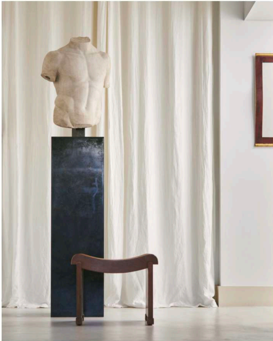
Tabouret Curule de Pierre Chareau en poirier, vers 1923. Miroir de Katsu Hamanaka en laque rouge profonde doré à la feuille d'or, vers 1935. Doryphore, d'après Polyclète, en marbre, daté romain, vers I er siècle apr. J.-C., h 70 cm.