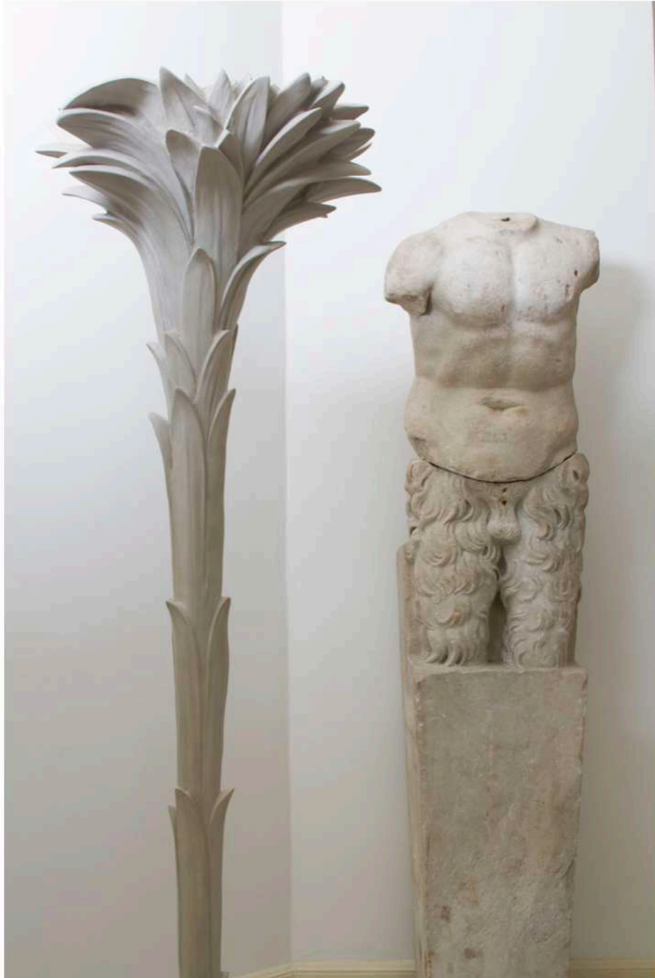
Lampadaire en plâtre de Serge Roche, vers 1935. Torse de Faune en marbre, romain, I er -II e siècle apr. J.-C., jambes en marbre italien, XVI e siècle.