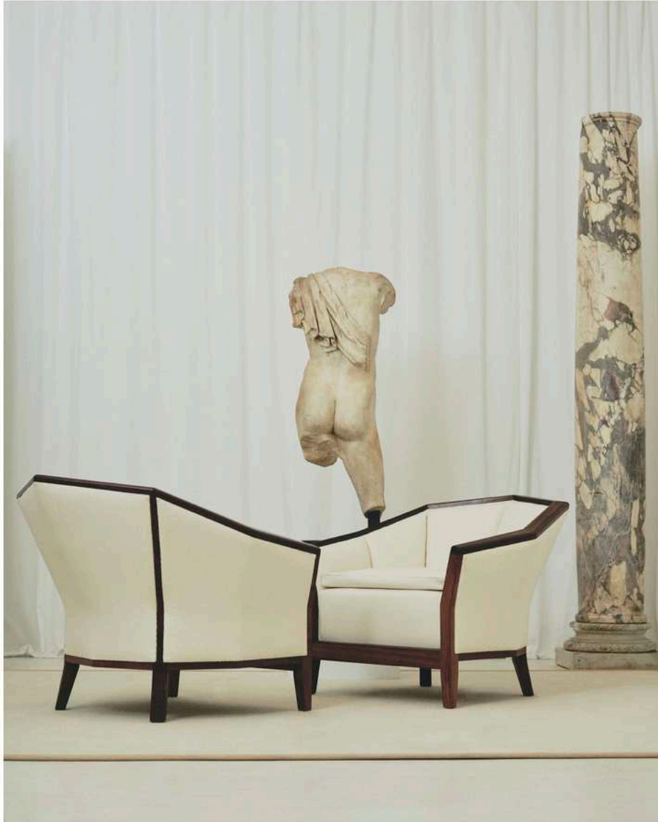
Paire de fauteuils de Pierre Chareau en bois de corail et recouverts de laine vierge, vers 1924. Torse de Dionysos en marbre, romain, I er -II e siècle apr. J.-C., h 94 cm. Paire de colonnes en marbre brèche, probablement romains.