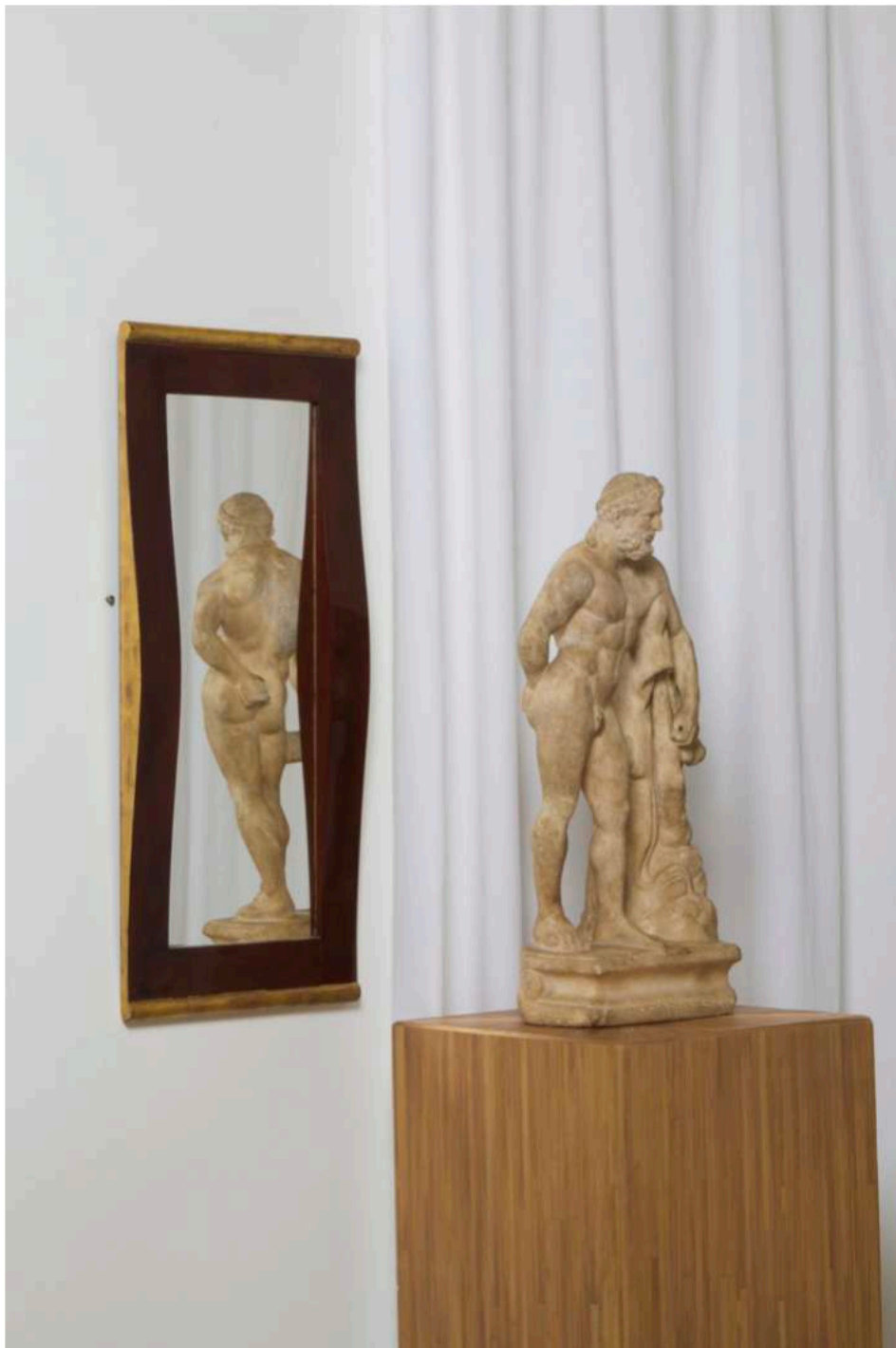
Miroir en laque rouge et doré à la feuille par Katsu Hamanaka, vers 1935. Hercule Farnèse en marbre, romain, II e siècle apr. J.-C.