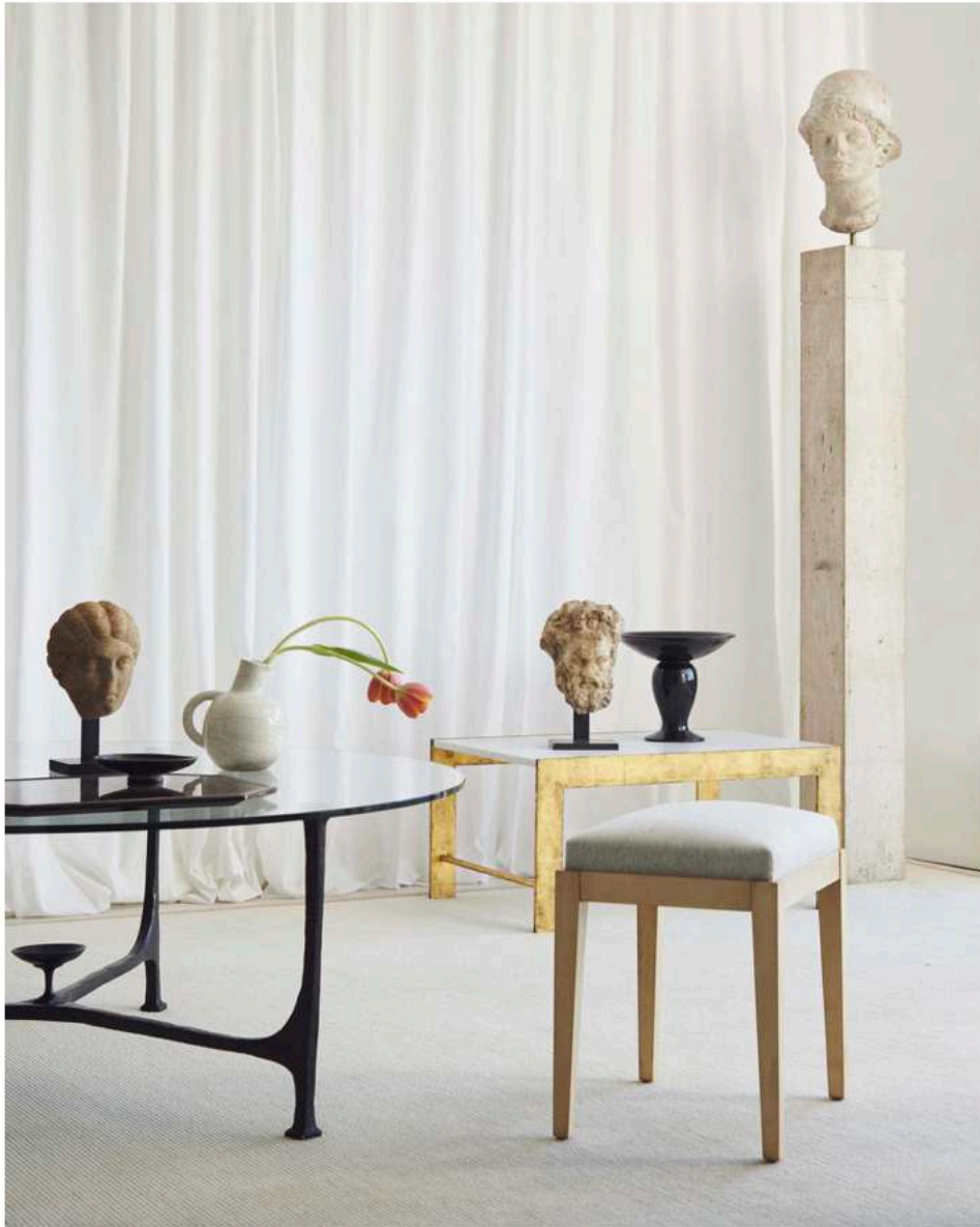
Table basse d'André Arbus en bronze et verre, vers 1958. Table basse de Marc du Plantier, fer doré et marbre, vers 1940. Paire de tabourets de Jean-Michel Frank en sycamore massif et assise en laine vierge gris cachemire, vers 1930. Vase de Jean Besnard, céramique, daté 1932. Coupe sur piédouche de Jean Besnard, céramique, datée 1931. Tête du type de la petite Herculanaïse en marbre, romain, II e siècle apr. J.-C., h 20 cm. Tête d'Hercule en marbre, romain, II e siècle apr. J.-C., h 30 cm. Tête d'un guerrier casqué en marbre, Hellénistique, II e -I er siècle av. J.-C., h 45 cm.