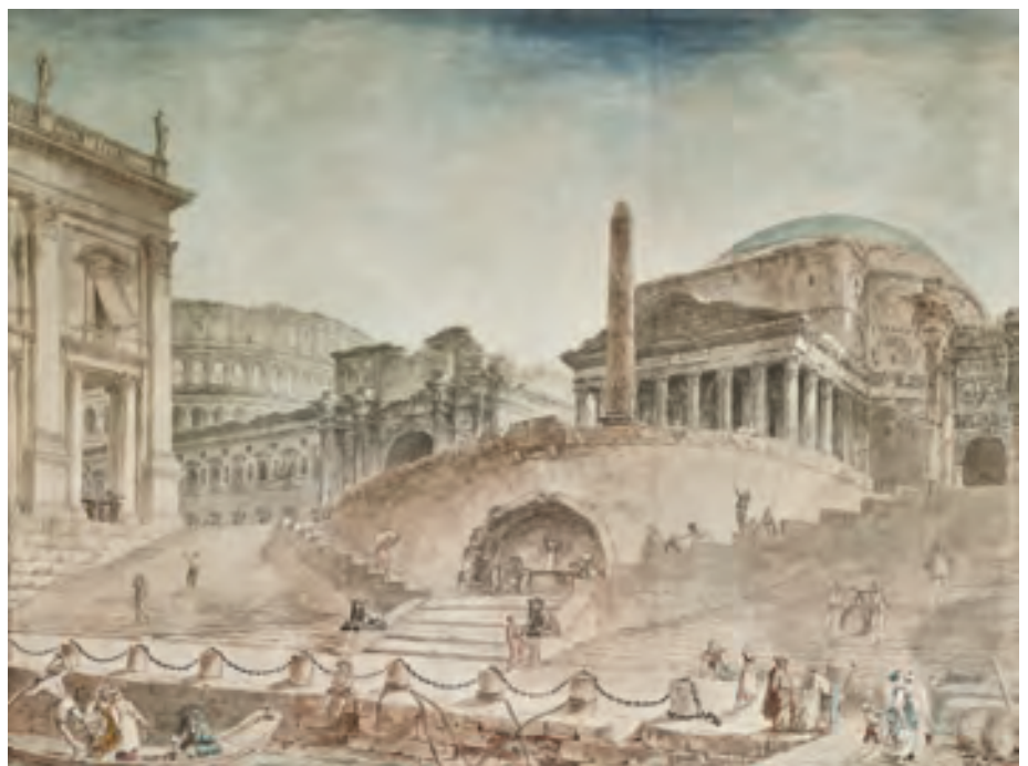
Hubert Robert, Caprice architectural avec le port de Ripetta, le Panthéon et le Colisée , vers 1758. Aquarelle, plume et encres brune et noire, pierre noire sur deux feuilles de papier vergé, 50 x 66,7 cm.

C'est une véritable invitation au voyage entre Rome et Paris que lance Éric Coatalem au curieux afin de célébrer le réveil tant attendu du monde de l'art. Installé depuis quelques années dans les anciens locaux de la légendaire galerie Cailleux, qui durant des années porta haut les couleurs de la peinture française du XVIII e siècle, Éric Coatalem s'inscrit résolument dans le sillage des grands accrochages qui firent la gloire de la galerie. Cinq ans après la remarquable exposition que le Louvre consacrait à Hubert Robert (1733-1808), le galeriste réunit en effet pour la plus grande joie des amateurs une cinquantaine d'œuvres. Des sanguines et aquarelles de sa longue période romaine aux assiettes peintes dans les geôles révolutionnaires, des grands formats aux peintures de chevalet, c'est la