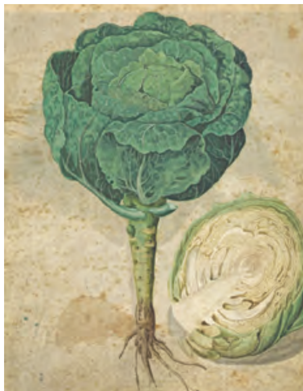
Étude de choux, Allemagne, XV e siècle. Aquarelle sur parchemin. Marseille, musée Grobet-Labadié.

Du 1 er au 4 juillet 2021 au Palais Brongniart, place de la Bourse, 75002 Paris. www.salondudessin.com