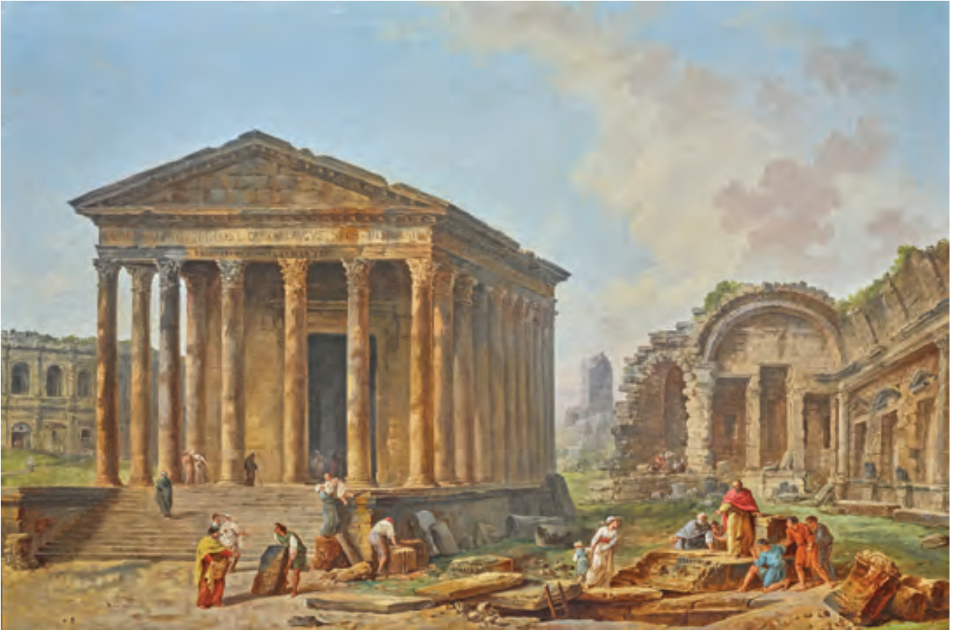
Hubert Robert, Caprice architectural avec des monuments de Nîmes , 1788. Huile sur toile, 67 x 98 cm.

C'est une véritable invitation au voyage entre Rome et Paris que lance Éric Coatalem au curieux afin de célébrer le réveil tant attendu du monde de l'art. Installé depuis quelques années dans les anciens locaux de la légendaire galerie Cailleux, qui durant des années porta haut les couleurs de la peinture française du XVIII e siècle, Éric Coatalem s'inscrit résolument dans le sillage des grands accrochages qui firent la gloire de la galerie. Cinq ans après la remarquable exposition que le Louvre consacrait à Hubert Robert (1733-1808), le galeriste réunit en effet pour la plus grande joie des amateurs une cinquantaine d'œuvres. Des sanguines et aquarelles de sa longue période romaine aux assiettes peintes dans les geôles révolutionnaires, des grands formats aux peintures de chevalet, c'est la