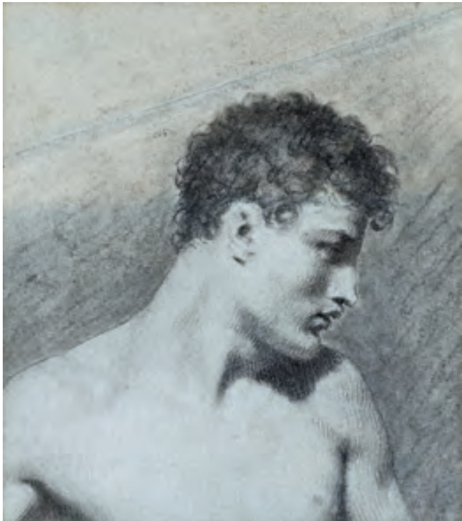
Pierre-Paul Prud'hon (1758-1823), Tête de jeune homme. Pierre noire, craie blanche sur papier bleu, 20 x 17,8 cm. Paris, galerie Benjamin Peronnet.

Annulé l'an passé pour cause de pandémie, le salon printanier se pare en 2021 des atours de l'été en investissant entre le 1 er et le 4 juillet l'écrin doré du Palais Brongniart. 33 galeries ont répondu présent cette année afin de célébrer les arts graphiques.