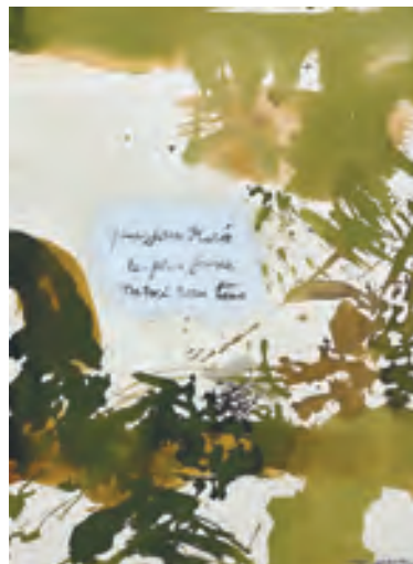
Zao Wou-Ki, Sans titre , 1978. Lavis d'encre et encre de Chine sur papier, 38,3 x 28,2 cm. Majorque, Arxiu Fotogràfic de la Fundació Pilar i Joan Miró. © courtesy of Fundació Pilar i Joan Miró, Mallorca

« Le plus jeune parmi nous tous : Zao Wou-Ki à propos de Joan Miró », jusqu'au 23 juillet 2021 à la galerie Mayoral, 36 avenue Matignon, 75008 Paris. www.galeriamayoral.com