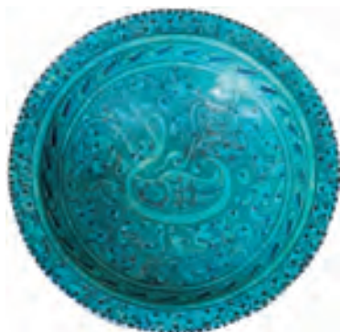
Coupe creuse en céramique siliceuse dit « de Djoveyn », art Ilkhanide, XIV e siècle, Iran. D. 28,5 cm.

Le Carré renoue cette année avec la tradition en proposant « les cinq jours de l'objet extraordinaire ». Entre le 9 et le 13 juin, amateurs d'art et collectionneurs pourront ainsi arpenter les vitrines des rues du Bac, de Beaune, de Lille, des Saints-Pères, de l'Université, de Verneuil et du quai Voltaire, à la recherche de la pièce rare ou insolite. Quelque 67 galeristes généralistes ou spécialisés dans les domaines les plus variés déploieront tout leur talent afin de mettre en scène les trésors qu'ils gardaient