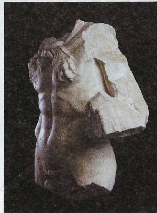
Torse romain d'Héraclès, 1 er -II e siècle, marbre.